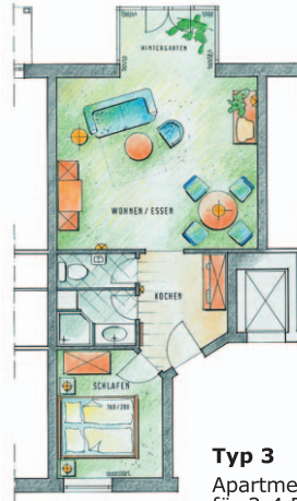
Typ 3 Apartment mit Wintergarten im OG für 2-4 Personen