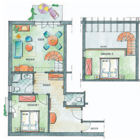
Typ 5 Apartment mit Balkon im DG für max. 6 Personen