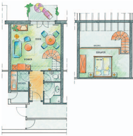
Typ 4 Apartment mit Balkon im DG für 2-4 Personen